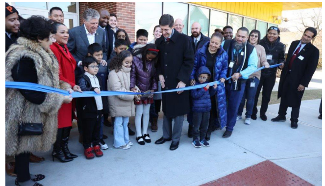
Seremoni koupe riban inogirasyon Spaziano Elementary School